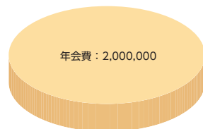
グラフ中の単位：円